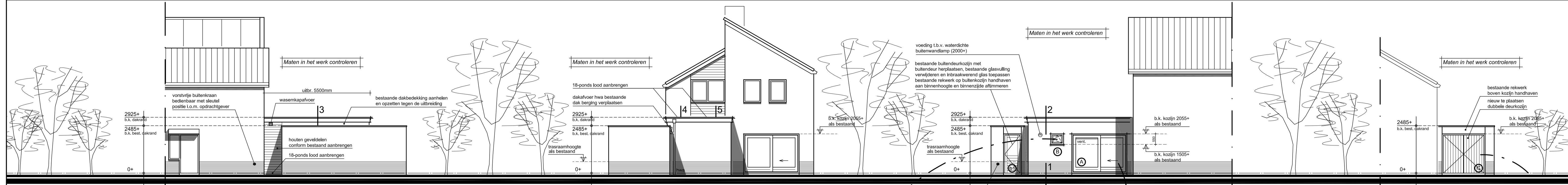
Rechter zijgevel gewijzigde situatie 1:100 Achtergevel gewijzigde situatie 1:100 Linker zijgevel gewijzigde situatie 1:100 Voorgevel berging gewijzigde situatie 1:100